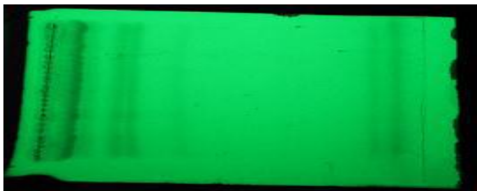
شکل ۲. جداسازی اجزای عصاره ایتیل استاتی به روش TLC (Thin-layer chromatography) با استفاده از سیستم

حلال ایتیل استات: تری فلورو استیک اسید: متانول: آب