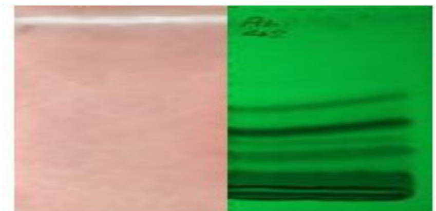
شکل ۳. مقایسه کروماتوگرام شاهد با هاله عدم رشد استافیلوکوکوس اپیدرمیدیس حاصل از بیواتوگرافی فراکسیون اتیل استاتی