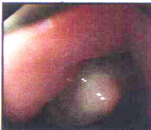
شکل ۱. در اندوسکوپی توده‌ای با سطح مخاطی نرمال در ناحیه انتر معده دیده می‌شود.

مطرح کرده بود، تصمیم به درمان جراحی تهاجمی در این بیمار گرفته شد، چراکه اگر تشخیصی غیر از لیپوما بعد از جراحی داده می‌شد، جراحی مجدد برای بیمار به لحاظ سن بالا با مورتالیتی و موربیدیتی بالا همراه می‌شد. در پیگیری‌های متعددی که طی یک‌سال بعد از عمل از بیمار به‌عمل آمد، هیچ‌گونه خونریزی گوارشی (آشکار و مخفی) مشاهده نگردید.