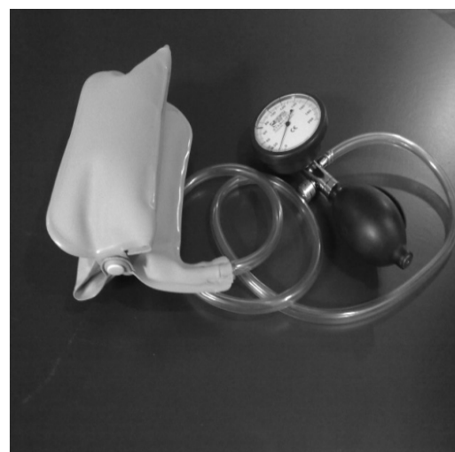
تصویر ۲. دستگاه کیسه فشار ST (Pressure Bio Feedback Unit)

برای به حداقل رساندن فعالیت عضلات فکی در حین اجرای تست از آزمودنی‌ها خواسته شد ضمن نگاه به سقف و لمس سقف دهان با زبان لب‌ها را ببندند ولی دندان‌ها را با کمی فاصله از هم نگه دارند. حداکثر فشار ST در طول اجرای تست خمش سری گردنی ثبت گردید (۱۲). برای اطمینان از اینکه عضلات قدامی گردن در طول اجرای این تست در استراحت کامل می‌باشند، در صفحه مانیتور دستگاه هیچ فعالیت و پتانسیل عمل واحد محرک (MUAP: Motor unit action potential) در حالت استراحت عضلات مذکور دیده نشد و در طول اجرای تست خط پایه موج در حالت خاموش بود. سپس آزمودنی‌ها تست ترکیبی (چانه به داخل برده می‌شود و بر روی ستون مهره‌های گردنی خم می‌شود) را اجرا کردند (۱۳). در این حالت فرکانس الکترومایوگرافی فعالیت عضلات سطحی را نشان می‌داد و حداکثر فشار ST در طول اجرای تست ثبت شد. مدت زمانی که به علت تماس بافت‌های زیر چانه موجب محدودیت تست می‌شدند، تست متوقف می‌گردید. اختلاف بین فشار کلی و فشار مربوط به عضلات عمقی، به‌عنوان فشار مربوط به عضلات سطحی محاسبه گردید. تمامی تست‌ها توسط یک آزمون گیرنده اجرا شد. اطلاعات به‌دست آمده با استفاده از آزمون t مستقل برای مقایسه میانگین بین گروه‌ها با سطح معنی‌داری P < 0.05 از طریق نرم‌افزار آماری SPSS16 انجام گرفت.