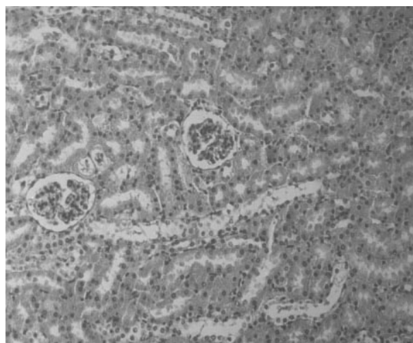
شکل ۳. فتومیکروگراف بافت کلیه در گروه دریافت کننده سرب ۰/۶ g/l سرب همراه با ۰/۴ g/kg عصاره (بزرگ نمایی ۱۰۰x)

سرب در بدن رادیکال آزاد ایجاد می‌کند که خود سبب سوپراکسیداسیون لیپیدهای غشاء می‌شوند. عصاره سیر آنیون سوپراکسید و رادیکال هیدروکسیل را اشغال کرده و از محیط سلولی دور می‌کند و پراکسیداسیون لیپید را تعدیل می‌نماید تا سلول وظیفه خود را ادامه دهد و از تخریب سلولی و بافتی جلوگیری به عمل آورد. همچنین یکی از نشانه‌های پراکسیداسیون لیپید، افزایش مالونیل دی آلدئید