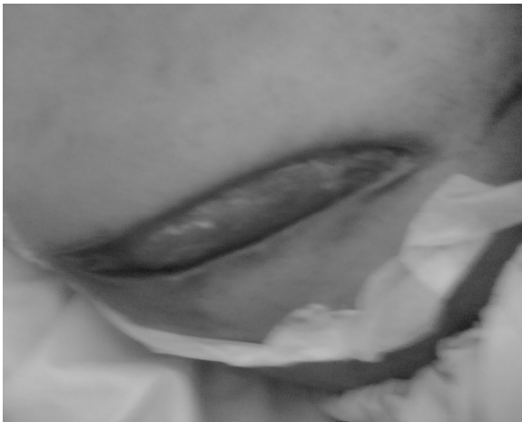
عکس ۱. برش ناحیه درناژ آنبسه بعد از کنترل عفونت در پهلوی راست

دیورتیکول‌های کولون تحت عمل جراحی قرار گرفت. برش جراحی در محل حداکثر تورم در ناحیه پهلوی راست داده شد (عکس ۱). عضلات داخلی جدار شکم کاملاً نکروزه همراه با ترشحات بدبو بودند که خارج گشته و ودبریدمان وسیع همراه شستشو صورت گرفت. درن‌های متعدد در ناحیه قرار داده شده و بعد از آن روزانه زیر بی‌هوشی عمومی، زخم شستشو داده می‌شد و در صورت نیاز دبریدمان انجام می‌گرفت و طی این زمان آنتی‌بیوتیک وسیع‌الطیف برای درمان مورد استفاده قرار گرفت تا اینکه زخم تمیز و قرمز رنگ شده و آماده ترمیم گردد.