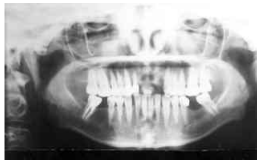
شکل ۲: رادیوگرافی OPG بیمار ۳ ماه پس از درمان نهایی

نمای رادیوگرافیک اکتینومیکوز رادیولوسنسی همراه با مرز نامنظم و حاشیه‌های نامشخص و غیراختصاصی می‌باشد (۹،۱۰،۱۳) و تشخیص قطعی بیماری توسط مشخص شدن ارگانیزم عامل است که به وسیله آزمایش مستقیم آگزودا، ارزیابی میکروسکوپی بافت‌های برداشته شده و یا کشت میکروبیولوژیک نمونه میسر می‌شود (۱۰). در دو مطالعه انجام شده گذشته‌نگر فقط در ۱۹ بیمار از ۱۸۱ بیمار و ۴ بیمار از ۵۷ بیمار تشخیص بیماری قبل از انجام بیوپسی داده شده بود. چون تشخیص اکتینومیکوز مشکل بوده و تشخیص‌های افتراقی برای آن در زمان تظاهرش وسیع است و حتی بعد از بیوپسی و یا