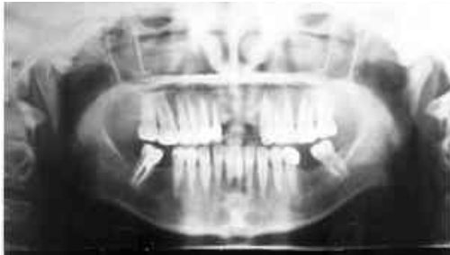
شکل ۱: رادیوگرافی OPG بیمار قبل از درمان نهایی

روز متعاقب عمل جراحی یاد شده بیمار با شکایت مجدد ترشح چرک از سمت چپ قدام فک بالا مراجعه نمود. در رادیوگرافی OPG در این مرحله از سیر بیماری (شکل ۱)،