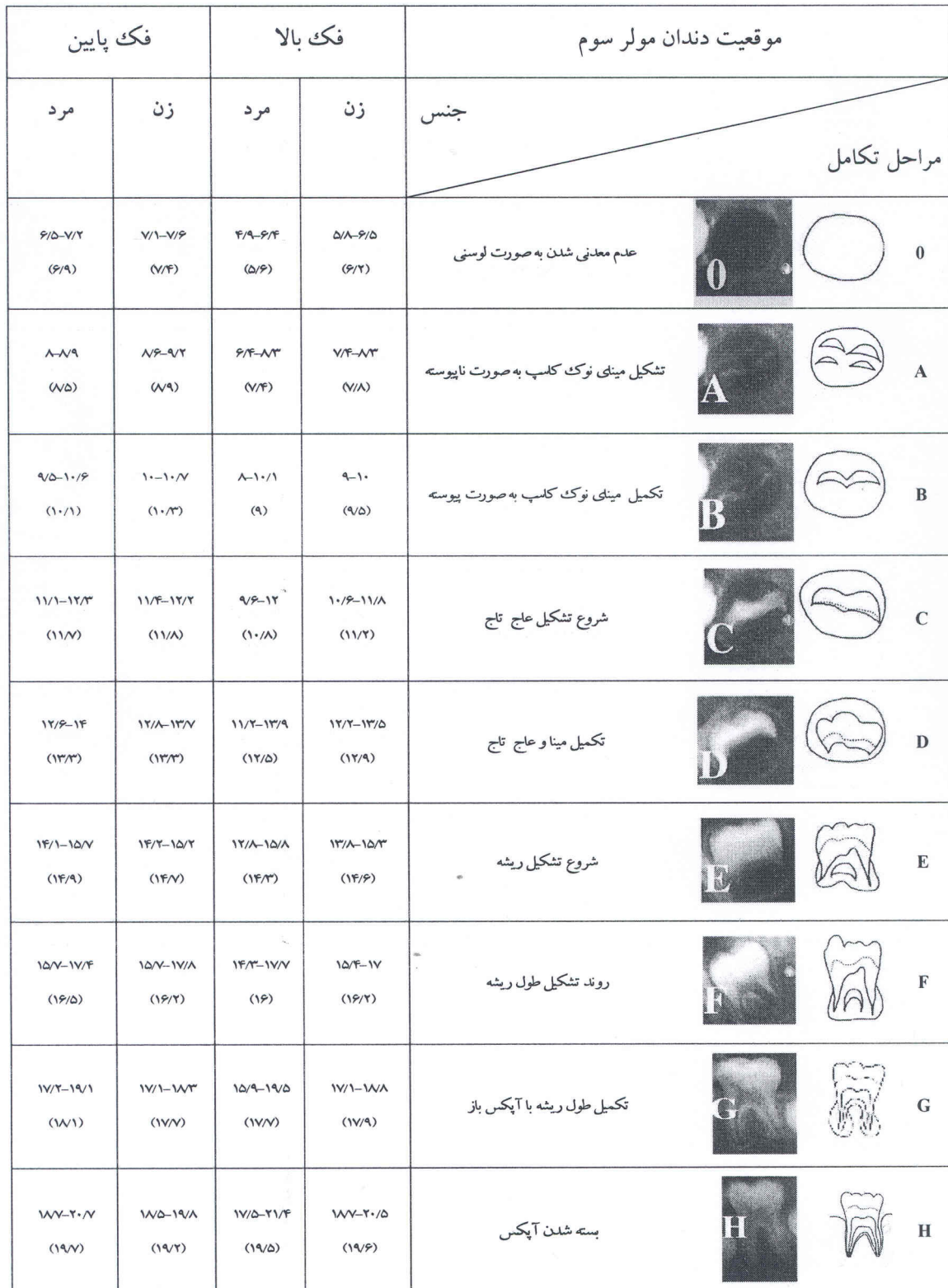
جدول ۴: ضریب وابستگی شاخص درجه‌بندی در برآورد سن تقویمی از روی مولر سوم فک بالا و پایین در هر دو جنس زن و مرد در نژاد ایرانی