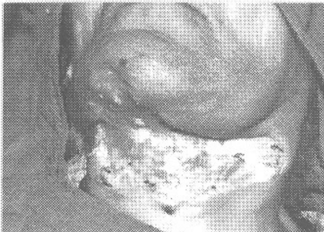
تصویر ۱: نمای اولیه زخم نکروتیک ناحیه چانه و گردن بیمار

در معاینه ناحیه چانه و گردن بیمار زخمی نکروتیک، گانگرنوس، عفونی، بدبو و بدون مرز مشخص با بافت طبیعی اطراف که از ناحیه چانه به گردن در خط وسط و طرفین گسترش یافته بود مشاهده می‌شد. رنگ پوست اطراف ضایعه تیره رنگ و ابعاد تقریبی ضایعه 12 \times 15 سانتی متر بود (تصویر شماره ۱). در معاینه داخل دهانی بیمار دندان‌های نکروزه \frac{6,2,1}{1,2} با تاج پوسیده و درگیری بافت پرپودنتال وجود داشت (تصویر شماره ۲). علائم حیاتی بیمار در زمان بستری شدن BP: 110/60، Temp.: 37.5، P.R.: 80 و آزمایشهای لابراتواری صبح روز بعد شامل: WBC: 12.6 \times 10^3 ، RBC: 4.8 \times 10^6 ، Hgb: 13.4 ، HCT: 37.6 ، Pit: 368 \times 10^3 ، FBS: 380 \text{mg/dl} و وجود (+) sugar و (+) Aceton در U/A و سایر یافته‌های آزمایشگاهی طبیعی بود. پس از بستری شدن بیمار در اولین فرصت ممکن تحت بی‌حسی موضعی بیوپسی از ناحیه گردن جهت تشخیص قطعی