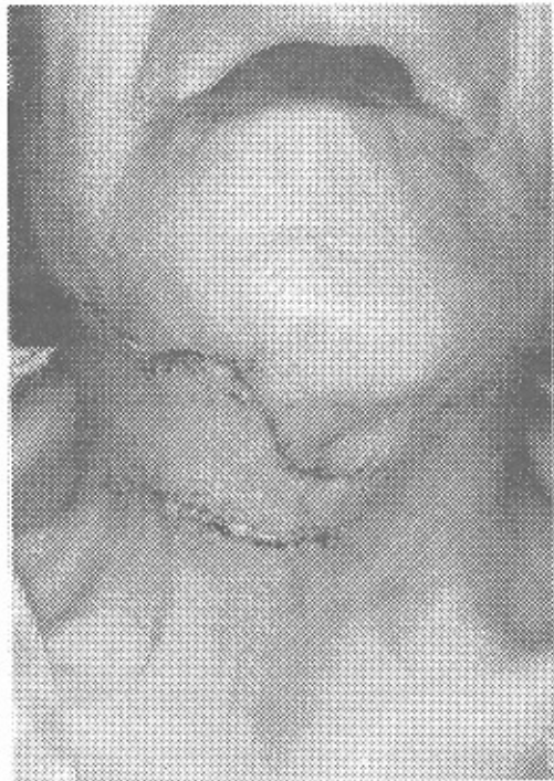
تصویر ۳: ترمیم زخم ناحیه گردن و چانه بیمار پس از درمان

می‌باشد) بیمار برای بار سوم به اطاق عمل منتقل و تحت بی‌هوشی عمومی، عمل پوشش کامل زخم ناحیه گردن و چانه توسط undermine کردن لبه‌های زخم در نواحی چانه و فوقانی دو طرف گردن و sliding flap ناحیه تحتانی گردن انجام شد. در زمان ترخیص قند خون بیمار کاملاً کنترل و به ۱۹۱ کاهش یافت. هیچ نشانه‌ای از عفونت در ناحیه مشاهده نمی‌شد و ترمیم کامل صورت گرفته بود. (تصویر شماره ۳)