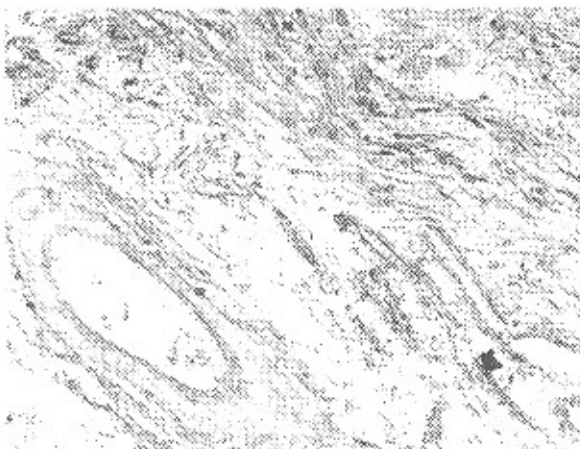
شکل ۳: نمای میکروسکوپی از تومور شوانومای کلیه‌ها با طرح آنتونی (B,A)