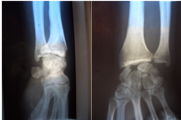
شکل ۱: نمای رادیوگرافی خلفی-قدامی و جانبی مچ دست بیمار به فاصله بین اسکافوئید و لونیت، زاویه لونیت و اسکافوئید در نمای جانبی توجه کنید.

استئوپوروز خفیف ناحیه هیچ گونه تغییرات دژنراتیو در رادیوگرافی دست مشاهده نگردید (شکل ۱).