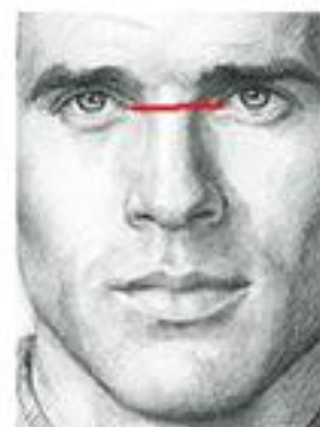
شکل ۲. اندازه گیری فاصله بین دو چشم