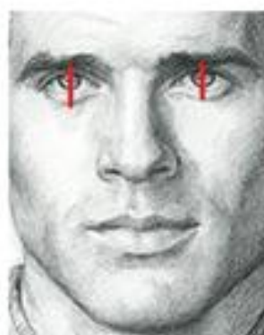
شکل ۴. اندازه گیری ارتفاع حفره چشم