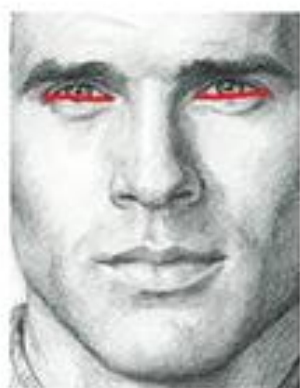
شکل ۳. اندازه گیری عرض حفره چشم

شخص مورد مطالعه رو به جلو می نشست. سپس با لمس توسط انگشت، نقطه کانتال خارجی مشخص می شد و میله ثابت کالیبر لرزشی روی آن قرار می گرفت و نقطه کانتال داخلی لمس می گردید و با پیچ تنظیم، دهانه آن باز می شد تا حدی که میله دوم بر روی نقطه پیش گفته قرار گیرد. سپس عدد مربوط قرائت و ثبت می گردید (شکل ۳).